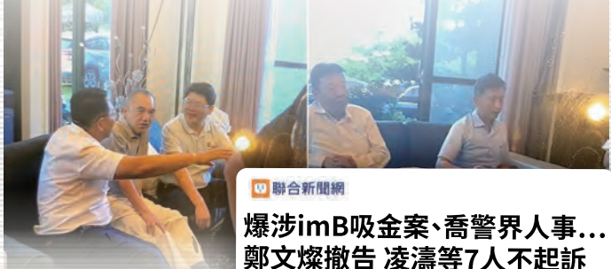
聯合新聞網 爆涉imB吸金案、喬警界人事... 鄭文燦撤告 凌濤等7人不起訴

2023年4月 im.B案爆發 負責人曾耀鋒透過網路詐騙 吸金超過25億, 上萬人受害 曾耀鋒吸金供養前民進黨立委陳歐珀 鄭文燦被控幫曾關說警界人士